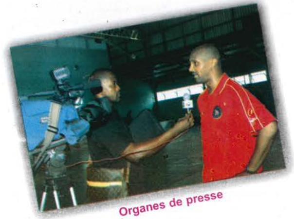
Organes de presse