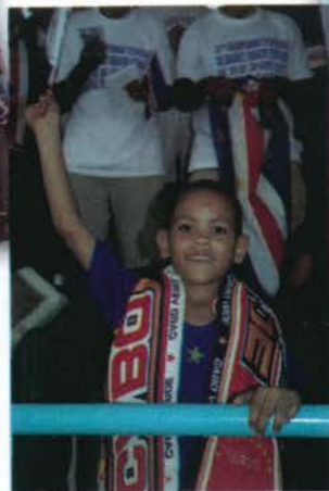
Plus jeune supporter Cap Vert