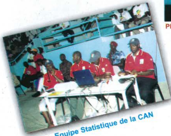
Equipe Statistique de la CAN