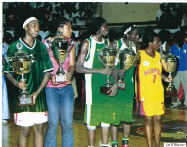
Le 5 Majeur