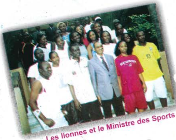
Les lionnes et le Ministre des Sports