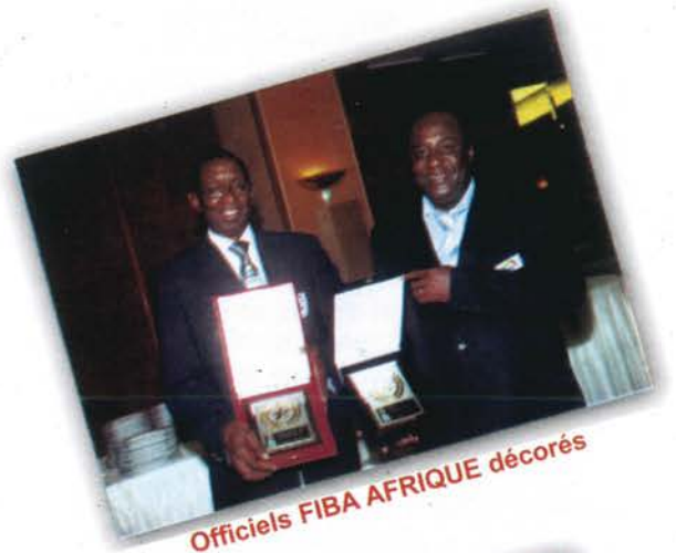
Officiels FIBA AFRIQUE décorés