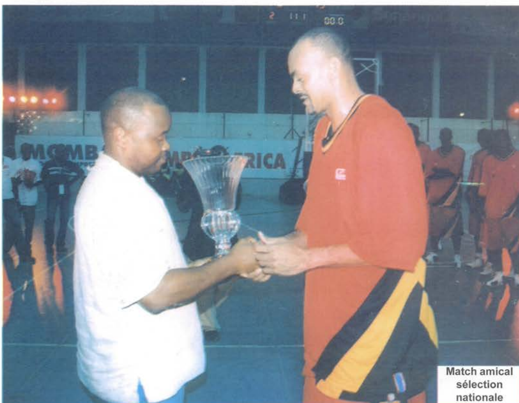
Match amical sélection nationale