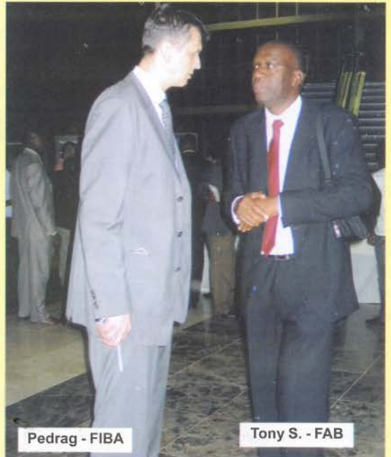
Pedrag - FIBA