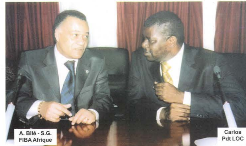
A. Bilé - S.G. FIBA Afrique