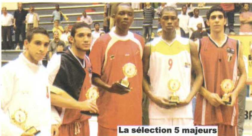
La sélection 5 majeurs