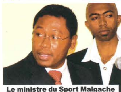
Le ministre du Sport Malgache