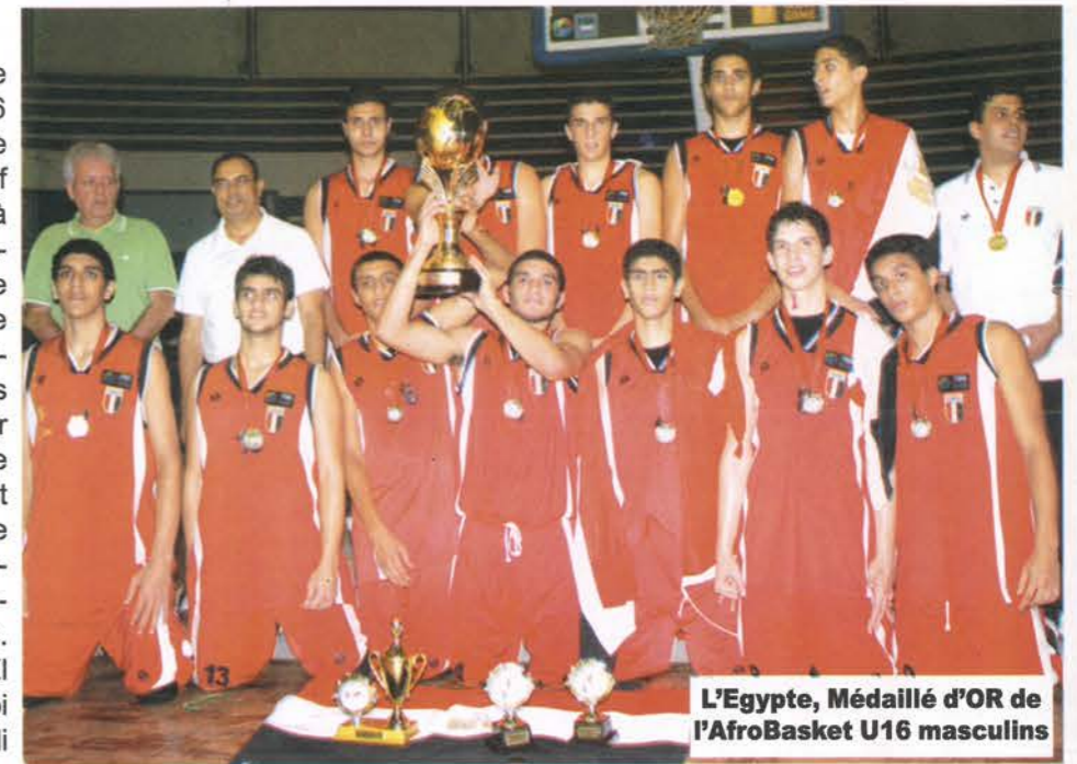
L'Egypte, Médaillé d'OR de l'AfroBasket U16 masculins

BA Afrique a franchi une étape importante dans le développement et la promotion du basket des jeunes en Afrique, en instaurant le contrôle de l'âge des joueurs par la radiographie. Cette méthode s'est avérée efficace parce que les résultats des contrôles des poignets des athlètes par la radiographie, effectuée par la Commission médicale de FIBA Afrique en collaboration avec un laboratoire agréé de Maputo, a permis d'épingler deux joueurs guinéens. Ces résultats ont été communiqués au Bureau exécutif de FIBA Afrique qui a pris les décisions qui s'imposent. En conséquence, la Guinée a perdu par pénalité les matches gagnés auxquels ces joueurs ont participé. Finalement, elle a été classée 9ème sur neuf participants. C'est un signal fort que FIBA Afrique vient de lancer à tous les pays africains, pour des compétitions de jeunes propres, reflétant l'âge réel des joueurs. L'avantage avec ce contrôle, c'est que tous les joueurs contrôlés lors de l'Afrobasket U16 2009, sont désormais identifiés au niveau de FIBA Afrique. Il ne sera plus possible de modifier leur âge pour les prochaines compétitions de jeunes.