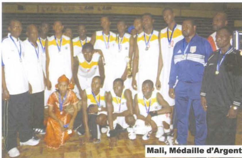
Mali, Médaille d'Argent