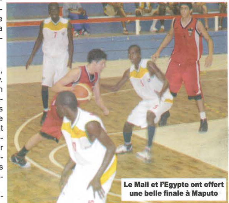
Le Mali et l'Egypte ont offert une belle finale à Maputo