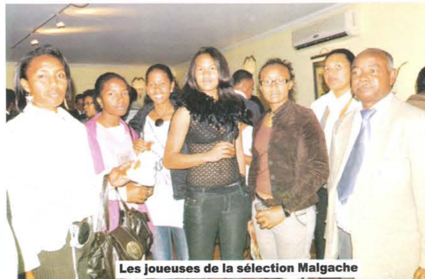
Les joueuses de la sélection Malgache