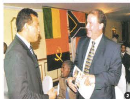
Les responsables des Fédérations du Sénégal (1), de l'Afrique du Sud (2) et du Rwanda (3)