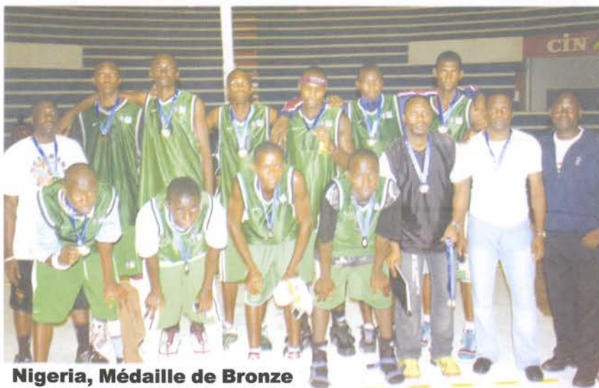
Nigeria, Médaille de Bronze