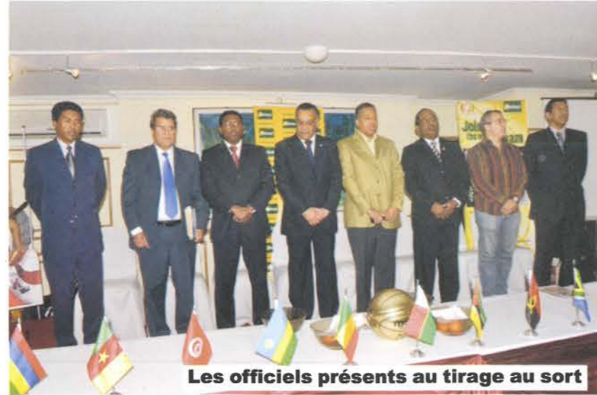
Les officiels présents au tirage au sort

(Champion d'Afrique 2007), l'Angola (médaillée de Bronze 2007), le Rwanda, la Côte d'Ivoire, le Nigeria et la Tunisie. Notons que l'équipe nationale de basket-ball malgache, présente à la cérémonie, a connu à cette occasion ses